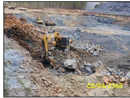
ลักษณะพื้นที่หน้าเหมืองในปัจจุบัน