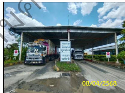
สภาพทั่วไปภายในพื้นที่โครงการ